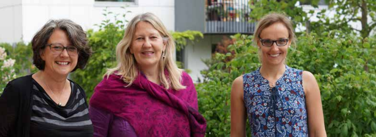
Ihr Team der Messestädter Nachbarschaftstreffs (v.l.n.r.):